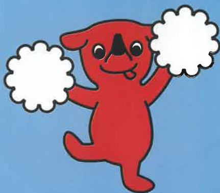
千葉県マスコットキャラクター 「チーバくん」